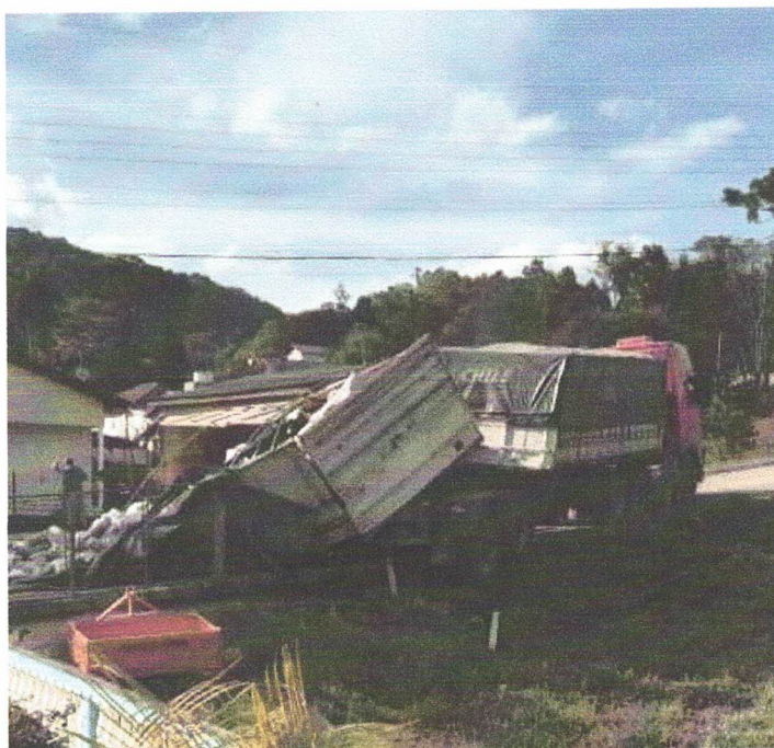
Sertão Santana, de 01 de setembro de 2022.